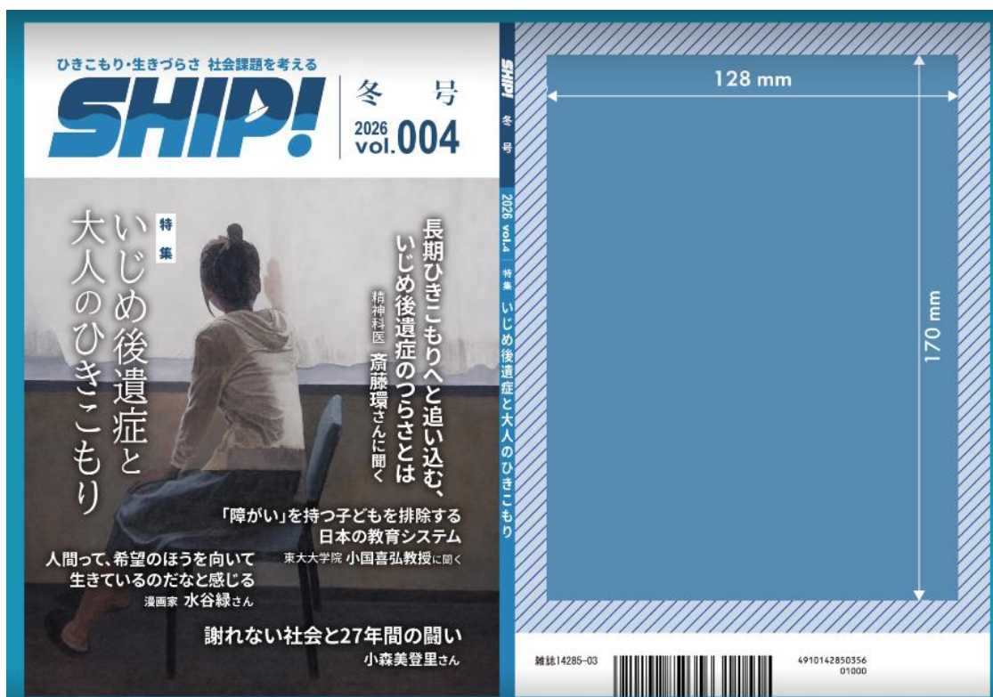
表4 広告スペース（縦 170mm × 横 128mm）